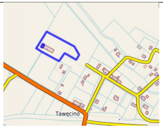
lokalizacja szczegółowa nieruchomości