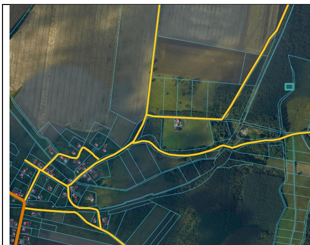
lokalizacja ogólna nieruchomości

Pierwszy przetarg ustny nieograniczony na sprzedaż przedmiotowej nieruchomości przeprowadzono dnia 4 października 2022 r.